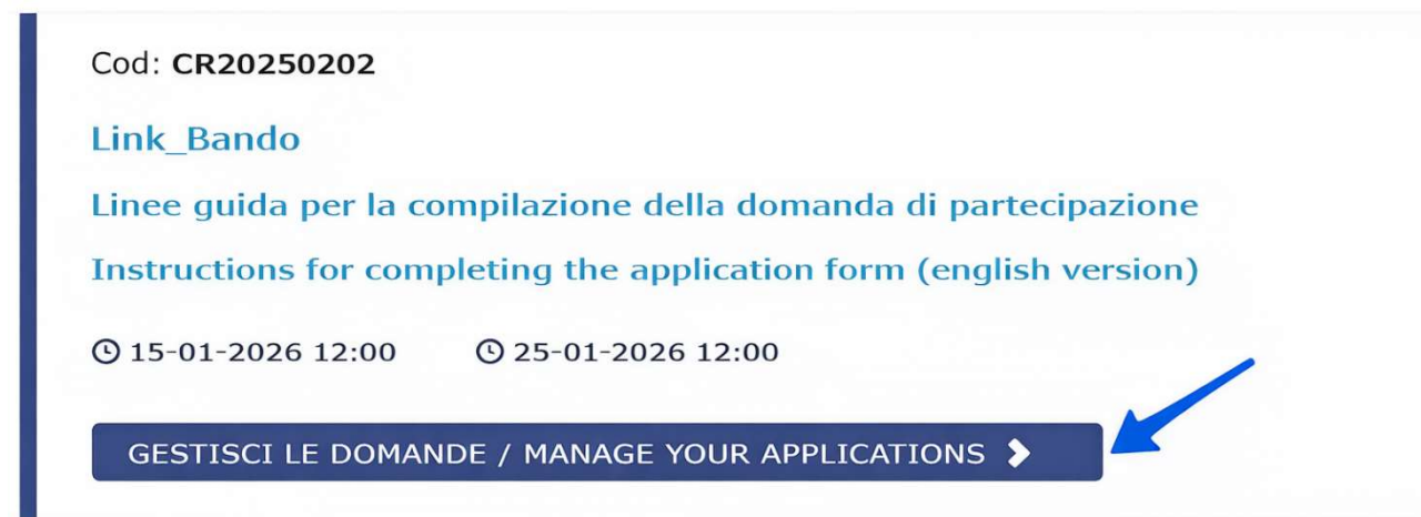
Figura 4 – Pulsante “Gestisci le domande / Manage your applications”.