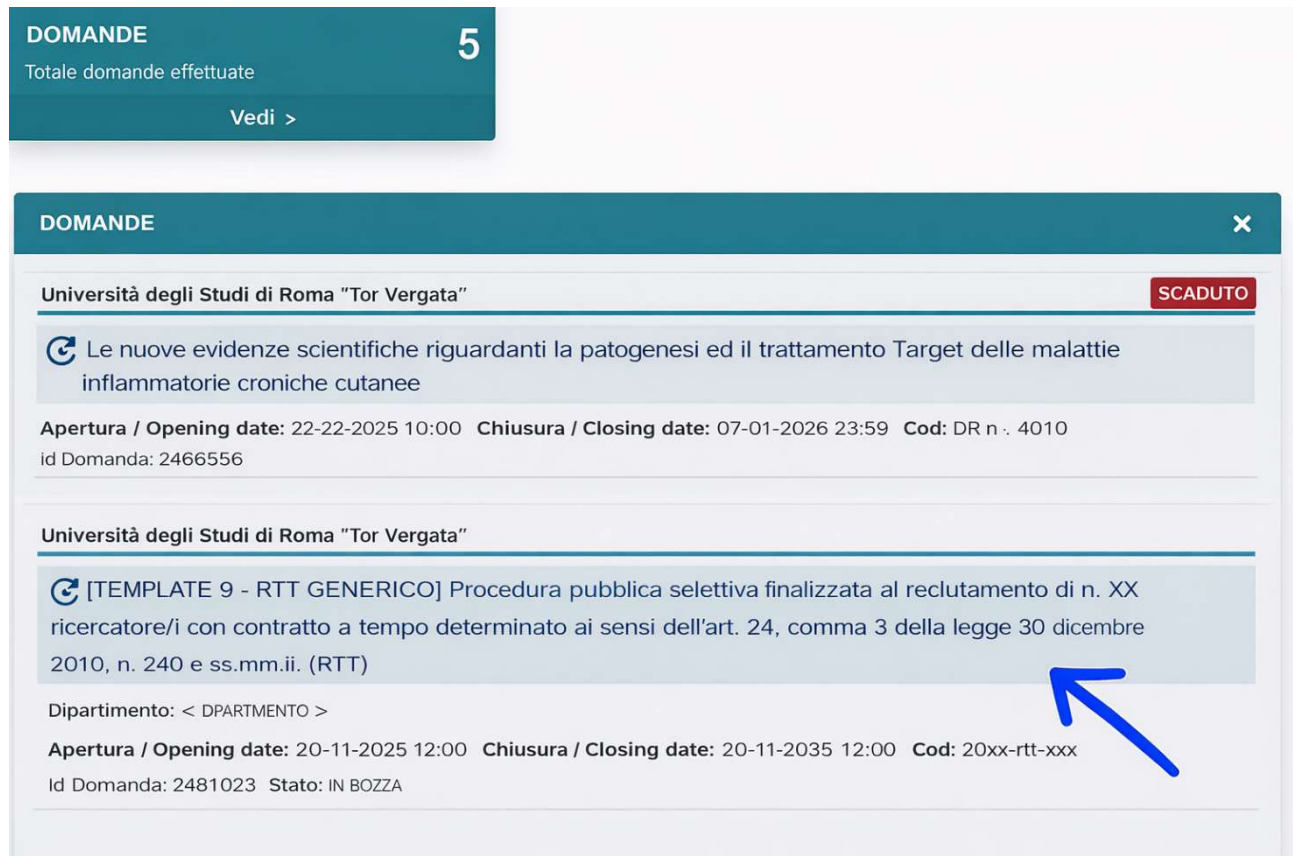
Figura 7 – dashboard “My PICA” (stato “In bozza”).

Le domande in bozza possono essere modificate e firmate cliccando sul titolo della domanda (in blu) .