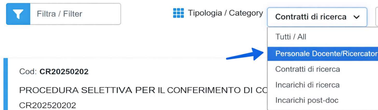
Figura 3 – Selezione della tipologia “Ricercatori in tenure track (RTT)”.